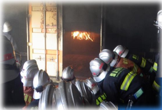
火災性状（火災の進展）

今後も引続き、地域住民の皆様を災害から守るため、更なる警防活動の能力向上に努めて参ります。