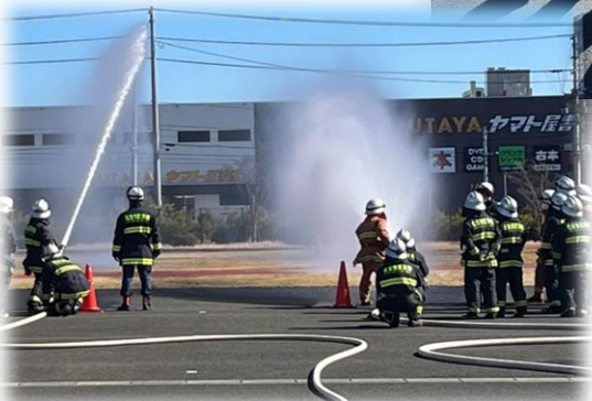
放水技術訓練（実放水）