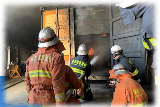
火災性状（出火室へ放水）