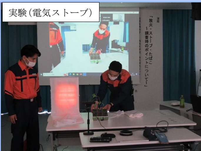
実験（電気ストーブ）