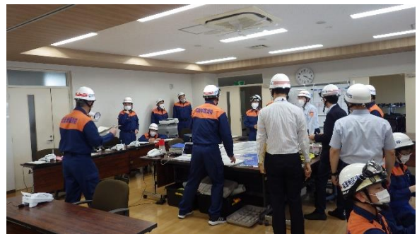
警防本部設置・運用状況