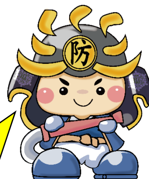
塩釜地区消防事務組合 マスコットキャラクター 「塩防くん」