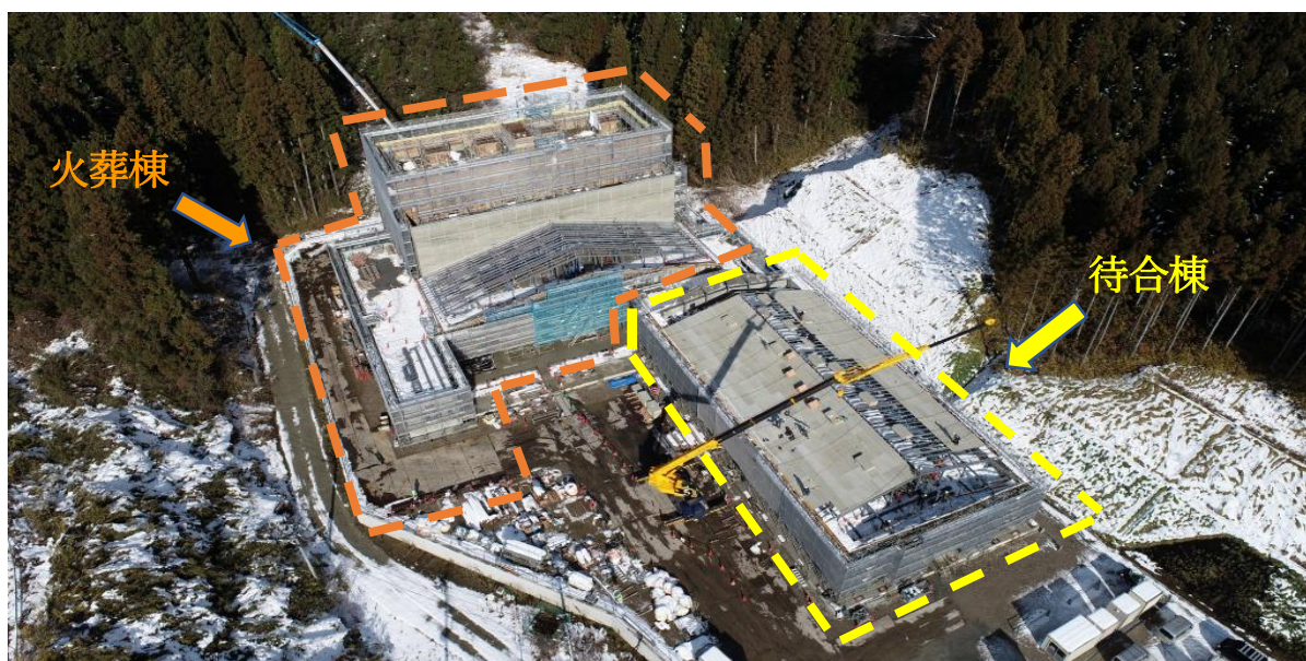
工事現場の様子（令和2年12月22日撮影）