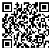
採用試験案内配付場所（ホームページ）

なお、書類の作成・提出にあたっては、申込書内にある「 申込書・受験票の記入要領 」を必ずご確認ください。