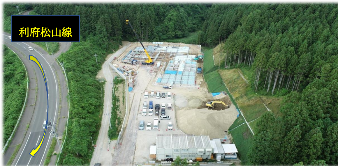
工事現場の全景（令和2年6月23日撮影）