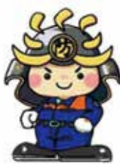
警防隊バージョン