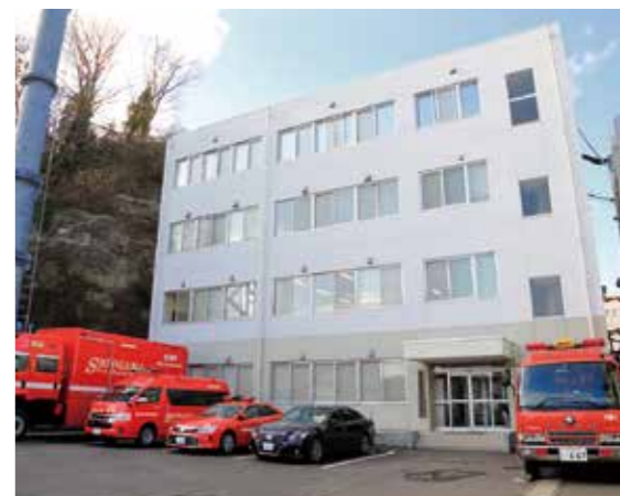
消防本部・事務局