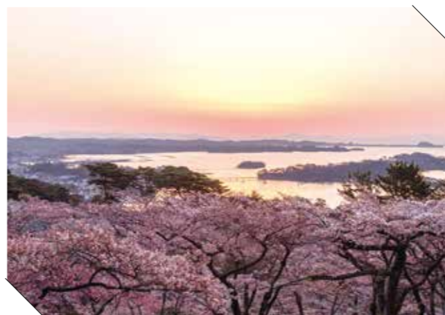
西行戻しの松公園

日本三景の一つ松島町は、古くから景勝地として知られ、瑞巖寺や五大堂など、多くの文化財と、観光施設、宿泊施設を有し、近年ではミシュランガイドで三つ星を獲得する観光地として評価を得ている。沿岸部では、かき養殖等の浅海漁業、北部では稲作を中心とした農業が盛んで、観光業をはじめ、農林業、漁業、商業など、様々な産業がバランス良く発達し、町の活力を支えている。