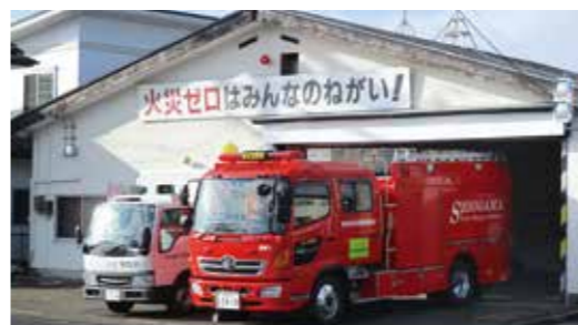
多賀城消防署 西部出張所