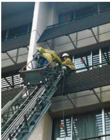
梯子車による訓練の様子

この50年間、当組合管内は、人口の増加とともに建物の高層化、価値観の変化、ニーズの多様化等社会情勢が大きく変化し、それに伴い火災などの災害も複雑多様化している。これらの災害に的確に対処するため、消防庁舎の開設・移設や消防車両の充実と相まって、専門的な知識・