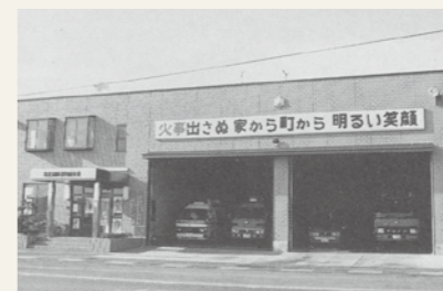
利府分署(現 利府消防署)