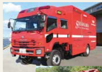
津波・大規模風水害対策車