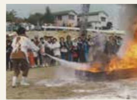
第1回消火技術コンクール