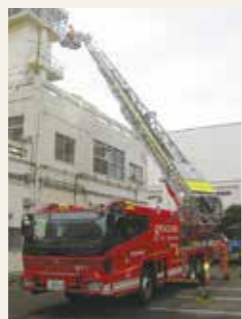
35m級先端屈折式梯子自動車