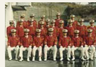
塩釜地区消防事務組合消防音楽隊