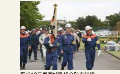
平成19年度宮城県総合防災訓練