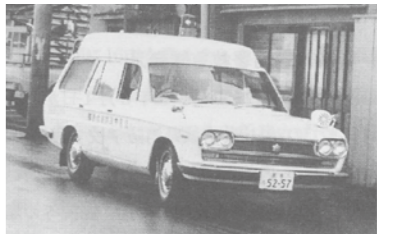
導入された救急自動車

42年10月、気仙沼市消防本部が昭和43年1月、そして塩釜市消防本部が同年3月に救急業務を開始した。 塩釜市消防本部では、この救急業務実施に先駆けて、昭和42年9月に宮城県消防学校で実施する救急講習に7名の署員を派遣。さらに内部規程として塩釜市消防救急業務取扱規程と救急出場記録原票作成要領を制定した。これが、塩釜市消防本部での救急業務の起源である。出場区