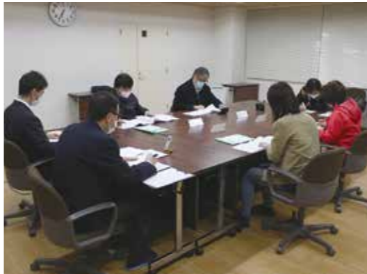
介護認定審査会の様子

介護サービスを受けるには、市町村に申請をして「介護や支援が必要な状態である」と認定される必要がある。その判定にあたるのが、介護認定審査会。介護認定審査会とは、市町村の附属機関として設置され、要介護者等の保健、医療、福祉に関する学識経験者によって構成される合議体であり、複数の市町村が共同で設置することも可能となっている。