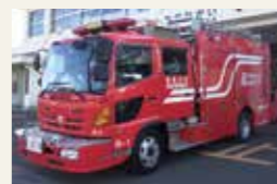
救助工作車(三代目)