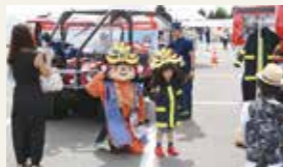
第46回全国消防救助技術大会 (車両展示ブース)