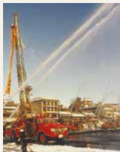
18m級梯子付消防ポンプ自動車