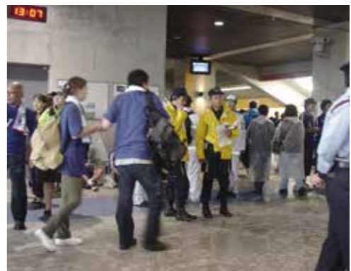
大勢の観客のなかで警備する職員

組合ではこのビッグイベントの警備に万全を期すため、県、関係市町、警察、自衛隊、医師会などの関係機関と何度も調整を図り警備計画を策定。また、県の仲立ちで県内11消防本部(当時)と応援協定を締結し、この11消防本部において