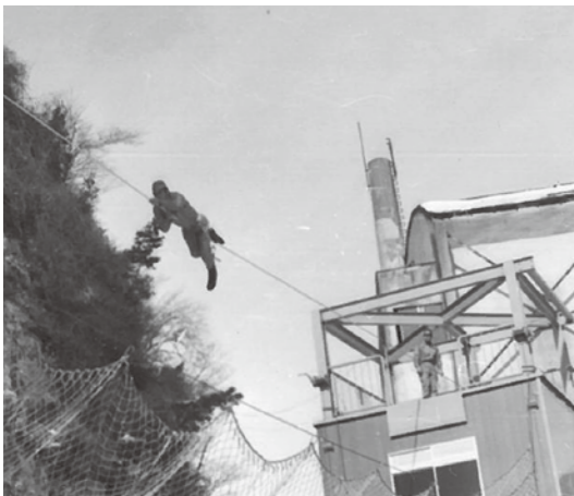
特別救助隊員の訓練の様子

時代が移った平成3年4月、新消防艇さくらが就航。先代のまつしまに比べ全長が5m程短くコンパクトかつ軽量になったほか、エンジンが100馬力ほど強力になり現場対応における機動性が格段にアップした。平成5年3月には新たな35m級梯子車を多賀城消防署に配備、梯子車3台体制となり、マンションをはじめとする高層建築物の災害対応力を一層強化した。さら