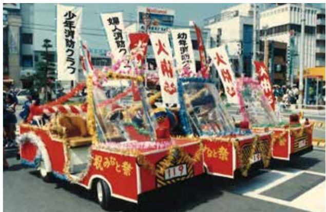
ゴルフカートをミニ消防車に模してパレードに参加

日本の高度経済成長に伴って、国内各所で昭和30年代後半から40年代にかけて石油コンビナートが形成されていった。石油コンビナート災害は、いったん発生すると瞬時に大規模な災害に発展してしまうため、災害対策が国によって定められたが、それでも大規模な石油流出事故やタンク火災などが発生した。それらが契機となって消防法等による危険物施設中心の、いわゆる点型の規制から、コンビナート区域全域を規制するという面型な防災上の規制措置を盛り込んだ、石油コンビナート等災害防止法が昭和51年6月1日から施