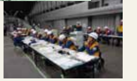
平成24年度 緊急消防援助隊ブロック訓練