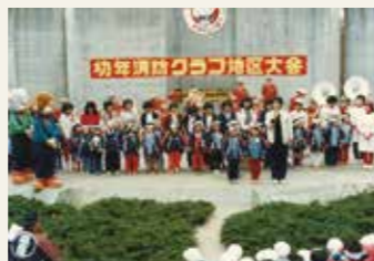
第1回幼年消防クラブ地区大会(県民の森)