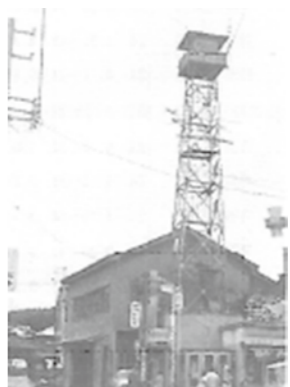
本塩釜駅に近くに建設された塩竈市消防本部署

さらに昭和43年には、多発する救急事故に対処するために、「救急業務応援協定」が締結され、名実ともに火災による被害の軽減と人命の救助にあたる体制が確保され、住民の信頼も一層強固なものとなり、これも組合消防結成の端緒となった。