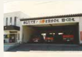
七ヶ浜分署(現 七ヶ浜消防署)