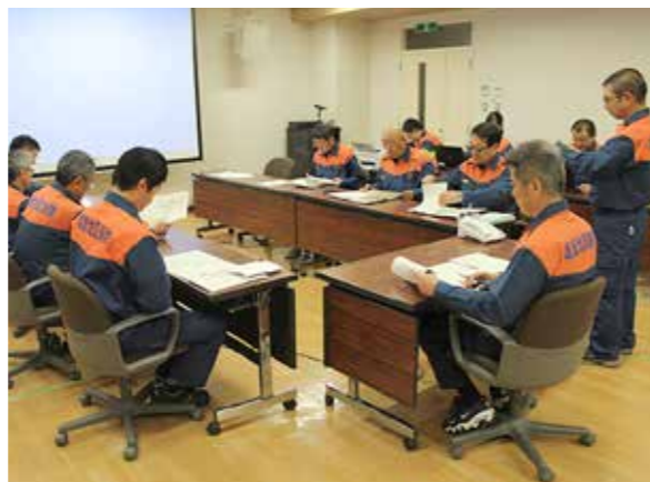
警戒本部会議の様子

そのような中、県内でも降雨量が多かった県南部を管轄とする仙南地域消防本部から0時50分に広域消防応援要請が出された。組合からは13日8時から丸森町へ職員を派遣。県内他の消防本部の職員とともに住民の安否確認や要救助者の検索、入院患者の病院転送支援などを行った。台風襲来の1週間後である19日土曜日にはまた強い雨が降ったため、その日の派遣は中止となったものの、その後も25日までに計12日間継続して職員を派遣し、延べ27隊69名が派