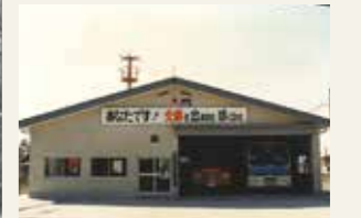
多賀城消防署西部出張所