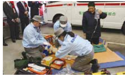
女性消防吏員の活躍の場が広がっている