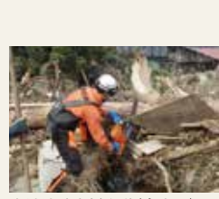
広域消防応援出動(丸森町)