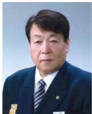
第九代消防長 芳賀 輝秀 平成17年11月1日～平成21年3月31日