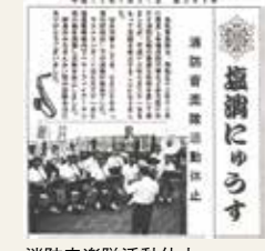
消防音楽隊活動休止