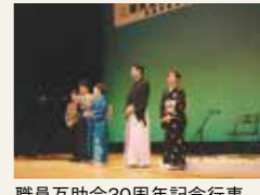
職員互助会30周年記念行事