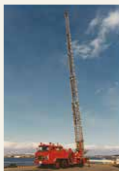
35m級梯子付消防ポンプ自動車