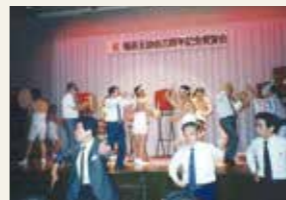
職員互助会創立20周年記念パーティ