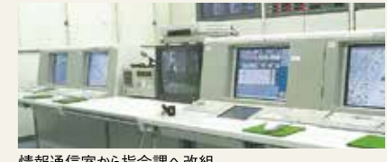
情報通信室から指令課へ改組