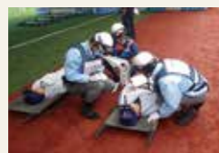
平成30年度 宮城県総合防災訓練(七ヶ浜町)