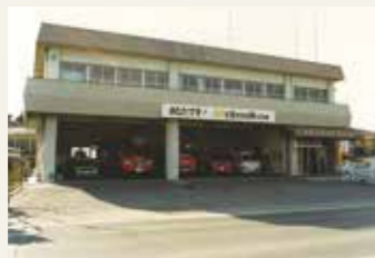
松島分署(現 松島消防署)