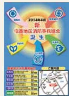
消防組合と環境組合の統合