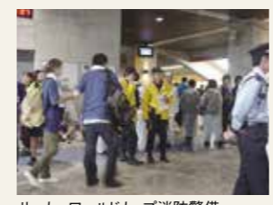
サッカーワールドカップ消防警備