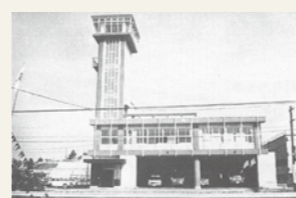
多賀城消防分署(現 多賀城消防署)