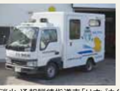
消火・通報訓練指導車「けすゾウくん」