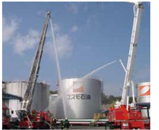
毎年実施される「宮城県石油コンビナート等防災訓練」の様子

特別防災区域に指定されたことにより、その後、塩釜、仙台両地区の事業所においてそれぞれ共同防災組織を結成し、共同防災センターを設置、共同して一体的な防災体制を推進していくこととなった。その後、昭和58年3月には、全国で初めて同法の適用を受けた防災緩衝施設として、周囲にスプリンクラー41基を設置した「塩釜港緑地みなと公園」が完成し、万一の事態に備え周囲地域の安全対策を全国に先駆けて行っている。また、平成15年の十勝沖地震による浮き屋根式屋外タンク貯蔵所の全面火災（鎮火まで約44時間を要した）を受けて、平成21年12月、秋田国家石油備蓄基地内に大容量泡放射システムが配備されている。