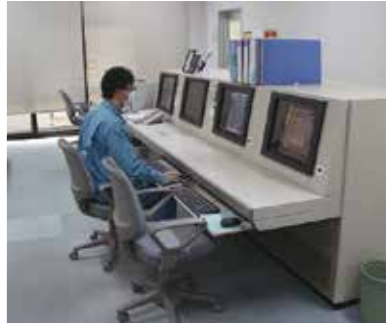
中央監視室で設備の運転管理をしている様子

そして初めての緊急消防援助隊の出動要請が入る。平成28年8月31日、台風10号による岩手県の北三陸エリアでの被害に対して、緊急消防援助隊宮城県大隊の派遣となった。同大隊は岩手県岩泉町に出動、この派遣は当組合から第三次派遣まで行っており、9月9日までの10日間で合わせて延べ68隊236名が出場。現地では住