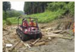
緊急消防援助隊派遣(岩手県岩泉町)