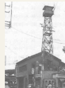
消防本部・塩釜消防署 (旧 塩竈市消防本部・消防署)