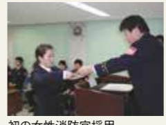
初の女性消防官採用