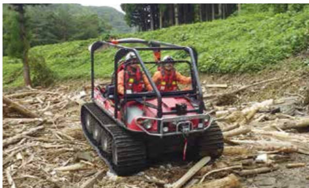
水陸両用バギーで活動する様子

阪神・淡路大震災では、消防庁からの出動要請を受けて全国41都道府県から延べ3万2400人の消防隊員が消防広域応援活動を実施した。その教訓を活かし、同年6月、全国の消防機関が速やかに効果的な災害初期における人命救助活動等を行えるよう、緊急消防援助隊が発足した。その編成は、指揮支援部隊、救助部隊、救急部隊、消防部隊、後方支援部隊からなっている（当時）。消防庁では、平成8年度から全国を6ブロックに分け、緊急消防援助隊の消火・救助技術や指揮・連携活動能力等の向上を図るため、緊急消防援助隊地域ブロック合同訓練を実施している。