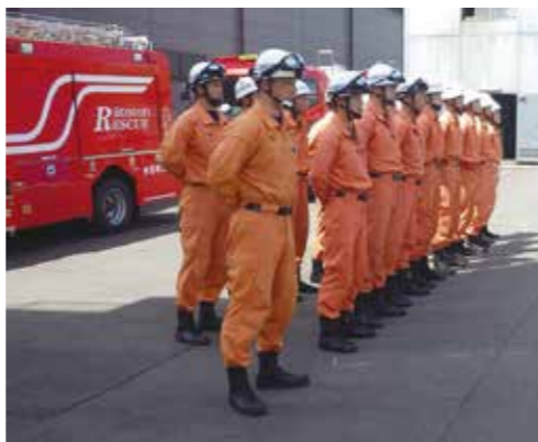
現在の特別救助隊

続く昭和49年には、ビル火災における人命救助、消火作業等に対応すべく組合初の梯子車（18m級）を導入し塩釜消防署へ配備。さらに昭和53年には高層建築物の災害対応に備え35m級梯子車を導入し塩釜消防署に配備。先の18m級梯子車は松島分署へ配置替えを行い、管内の梯子車が塩釜、松島の2台体制となり消防力強化が図られた。なお、この35m級梯子車はモニターノズルを梯