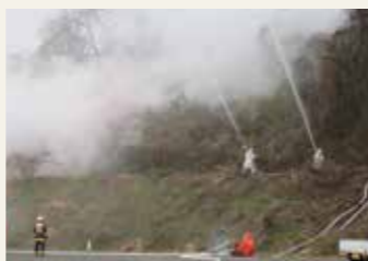
平成28年度宮城県林野火災防ぎょ訓練(利府町)