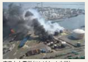
東日本大震災(コンビナート火災)