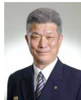
第十三代消防長 柴 正浩 平成30年4月1日～