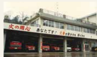
消防本部・塩釜消防署(現 塩釜消防署)