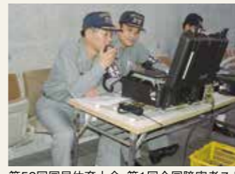
第56回国民体育大会、第1回全国障害者スポーツ大会