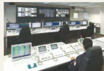
高機能消防通信システム(消防指令センター)