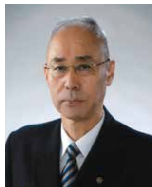
第十二代消防長 並木 明 平成26年4月1日～平成30年3月31日