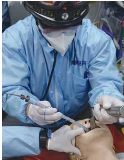
気管挿管の訓練をする救急救命士

昭和50年10月30日、救助活動の増加や18m級梯子車の導入に合わせ「特別消防隊設置要綱」が定められ、レスキュー隊カラーのオレンジ色の訓練服を採用し正式な発足となった。その後、昭和53年1月には消防本部庁舎裏（現在の塩釜消防署裏駐車場）に救助訓練塔が完成、昭和59年11月には組合初となる救助工作車を配備した。時代が変わった平成4年3月には、利府消防分署（現在の利府消防署）敷地に救助訓練塔が完成。現在も隊員の定期訓練のほか、消防救助活動に不可欠な体力、精神力、技術力を養うことを主な目的とした全国消防救助技術大会へ向けた訓練塔としても活用している。最近では平成24年3月に3代目となる管内唯一の救助工作車の更新配置を行った。