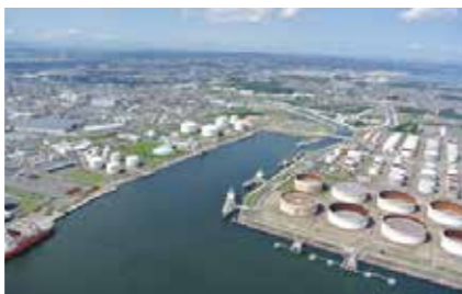
塩釜地区(上)と仙台地区(下)の石油コンビナート