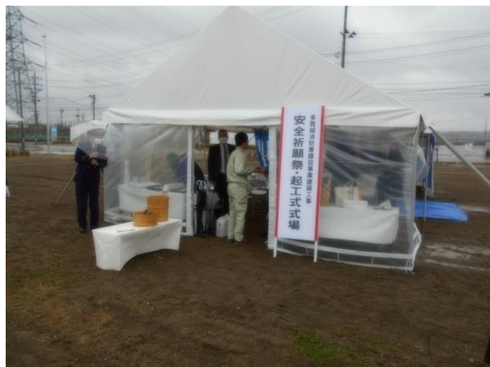
式典会場の設営状況

今後は、令和3年4月からの新庁舎による供用開始を目指し、安全第一に工事を進めてまいりたいと考えておりますので、地域住民の皆様方の御理解をお願いいたします。