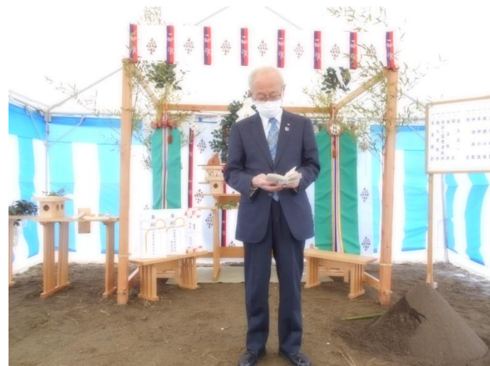
【起工式】菊地副管理者による施主挨拶