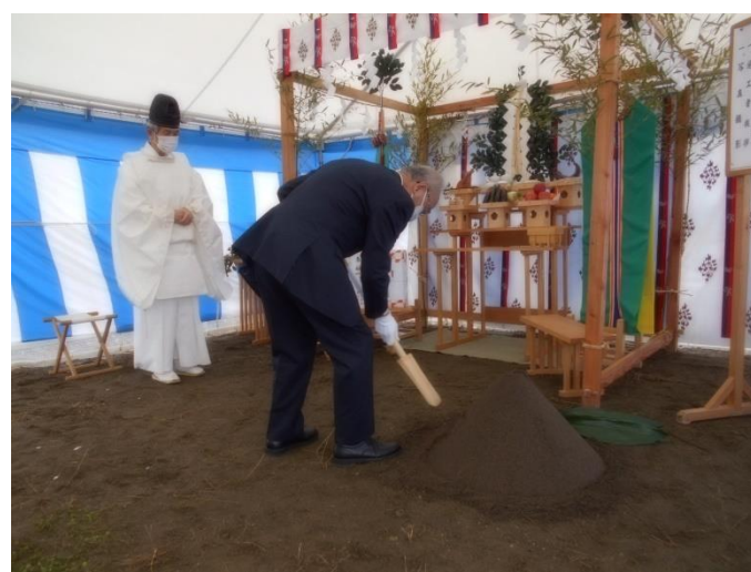
菊地副管理者による鍬入れの儀