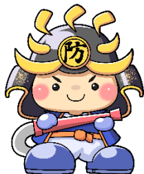
塩釜地区消防事務組合マスコットキャラクター 「塩防（しおぼう）くん」